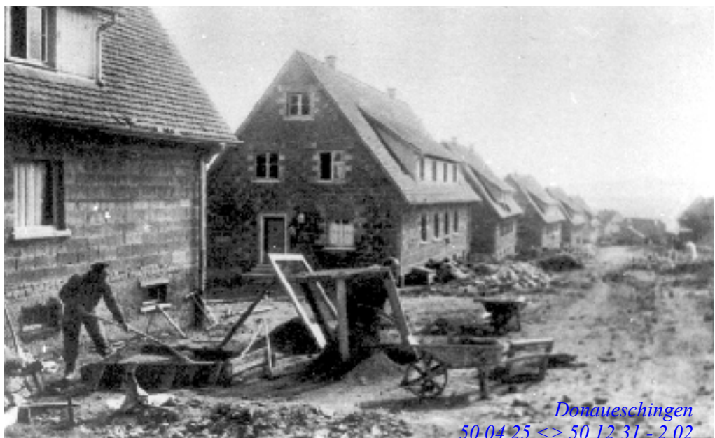
Donauwiesing 50 04 25 <> 50 12 31 - 2 02