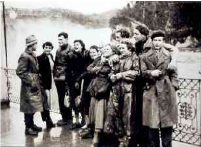
Ein Ausflug des Lagers zum Rheinfall bei Schaffhausen Im Dezember 1950