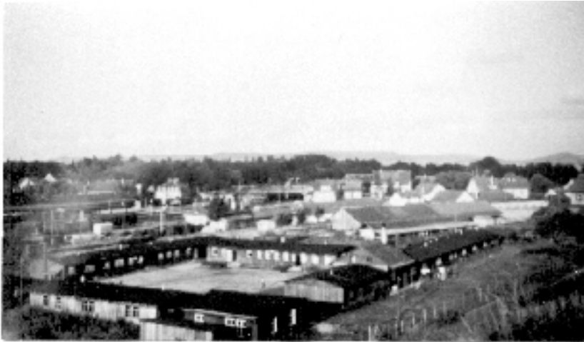
Das "Kreisumsiedlungslager" hinter dem Bahnhof als Quartier des Zivildienstes