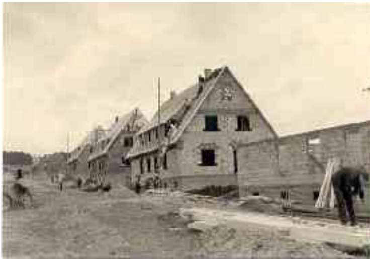
Donauwiesing 50 04 25 <> 50 12 31 - 2 01