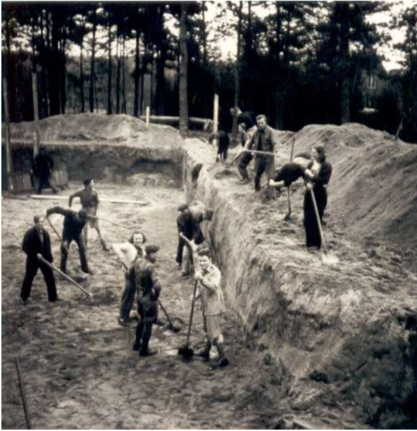
Aushub der Baugrube für das geplante neue Gebäude

Holm - Seppensen I 49 04 03 - 49 04 24 - 2 01