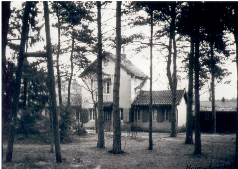
Das Hauptgebäude der 1949 bereits bestehenden Anlage