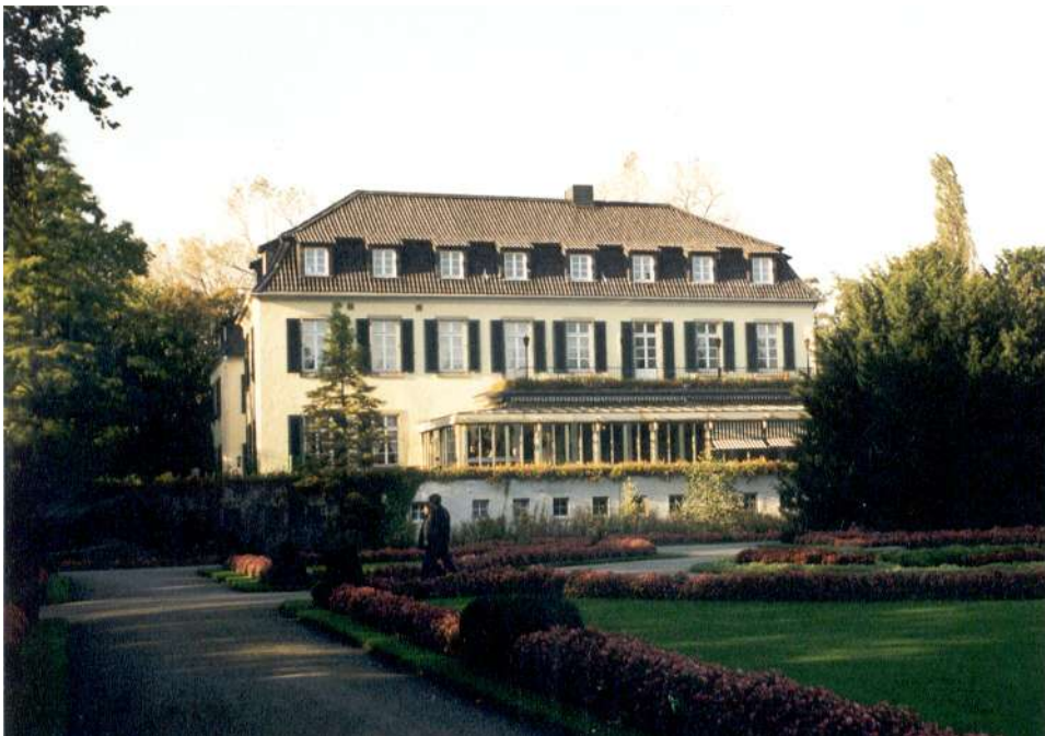
Hotel Schloß Berge 1998

davon aus : CH 1 - 1 D 10 10 20 GB 2 1 3 N 1 - 1 NL - 1 1 USA - 1 1