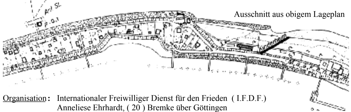
Ausschnitt aus obigem Lageplan