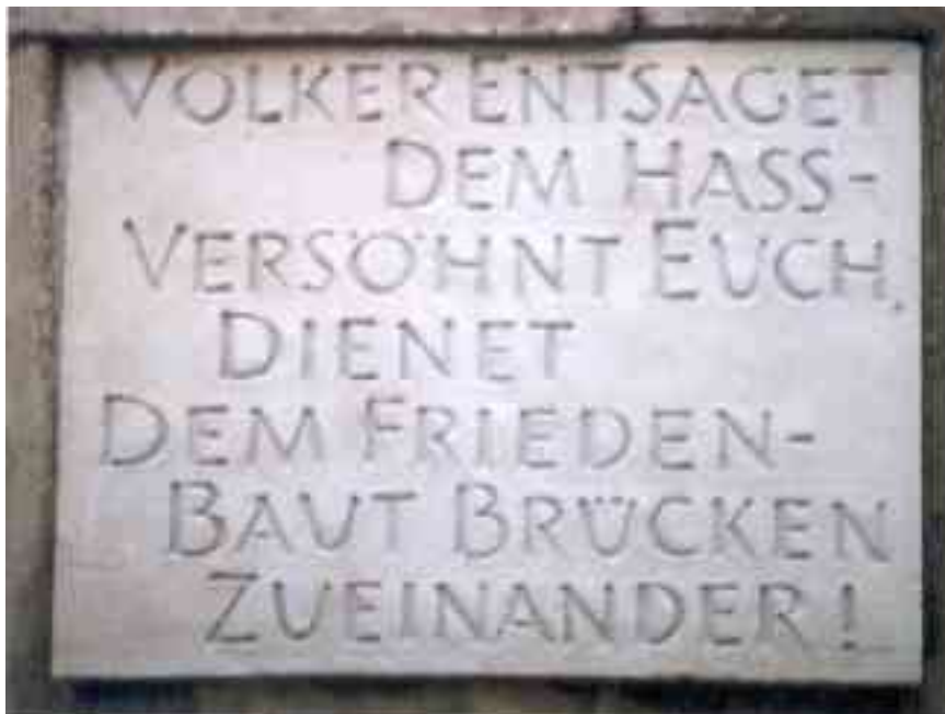
Inschrift auf dem Mahnmal