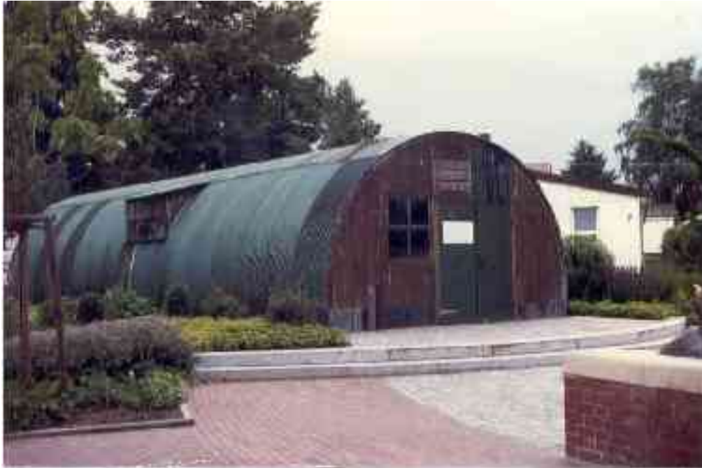
Nissenhütte als Museum des heutigen "Grenzdurchgangslagers Friedland"