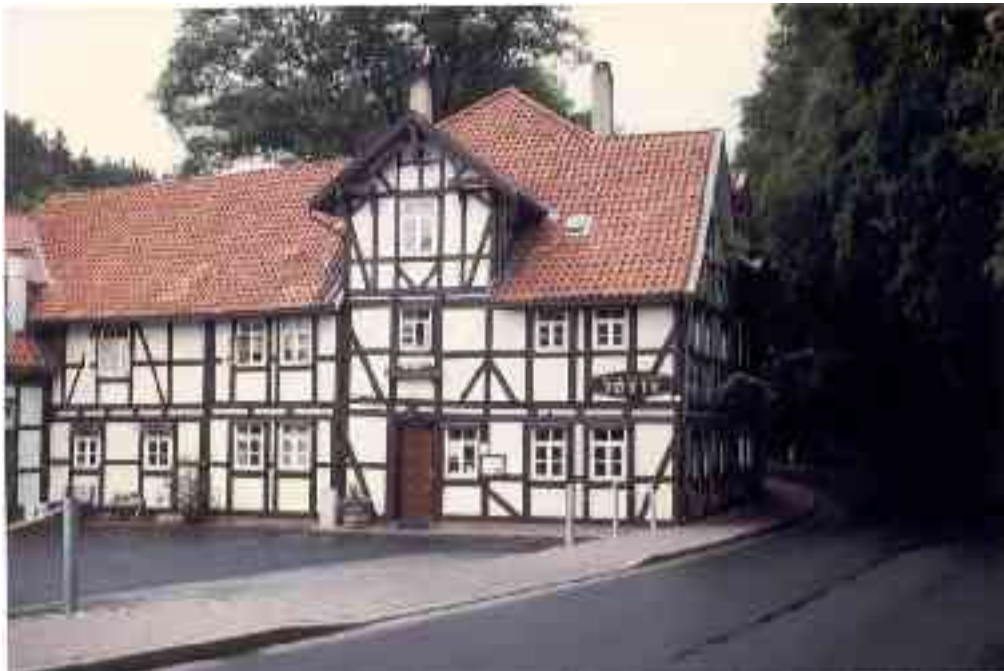
Gasthof Jütte in Bremke, das ehemalige Quartier des I.V.S.P.